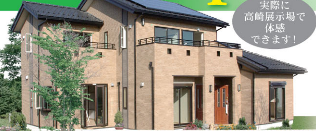
高崎展示場「フリーマ エコ ドゥーブル」外観

オネスティーハウス石田屋 2010.1.2.Sat くらしのギャラリー 高崎展示場